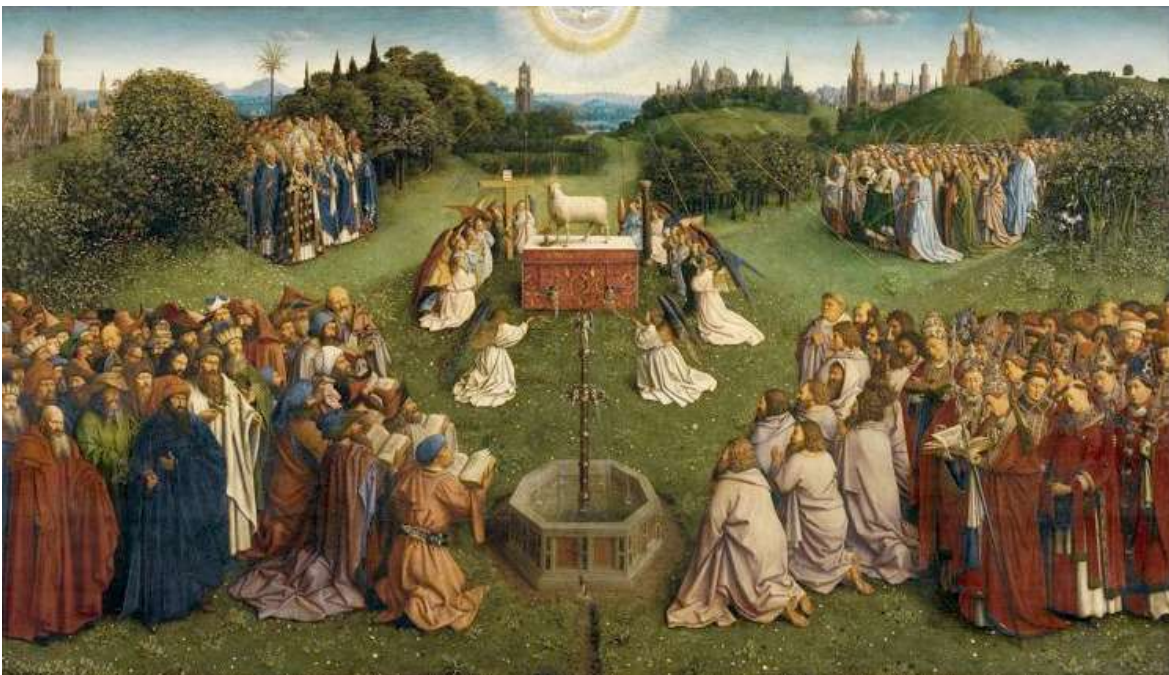
(het Lam Gods van Jan van Eyck)