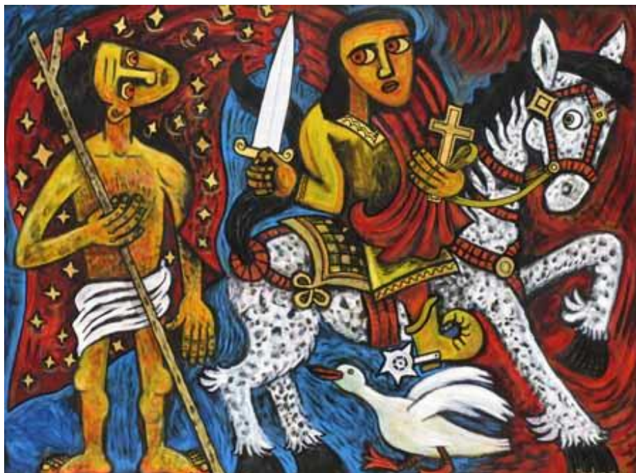
st Martinus deelt zijn mantel | Brian Whelan

Zo iets werd ook gezegd door de profeet Samuel tegen koning Saul: "Hierbij scheurt de HEER het koningschap over Israël van u los en geeft hij het aan iemand anders, iemand die waardiger is dan u."