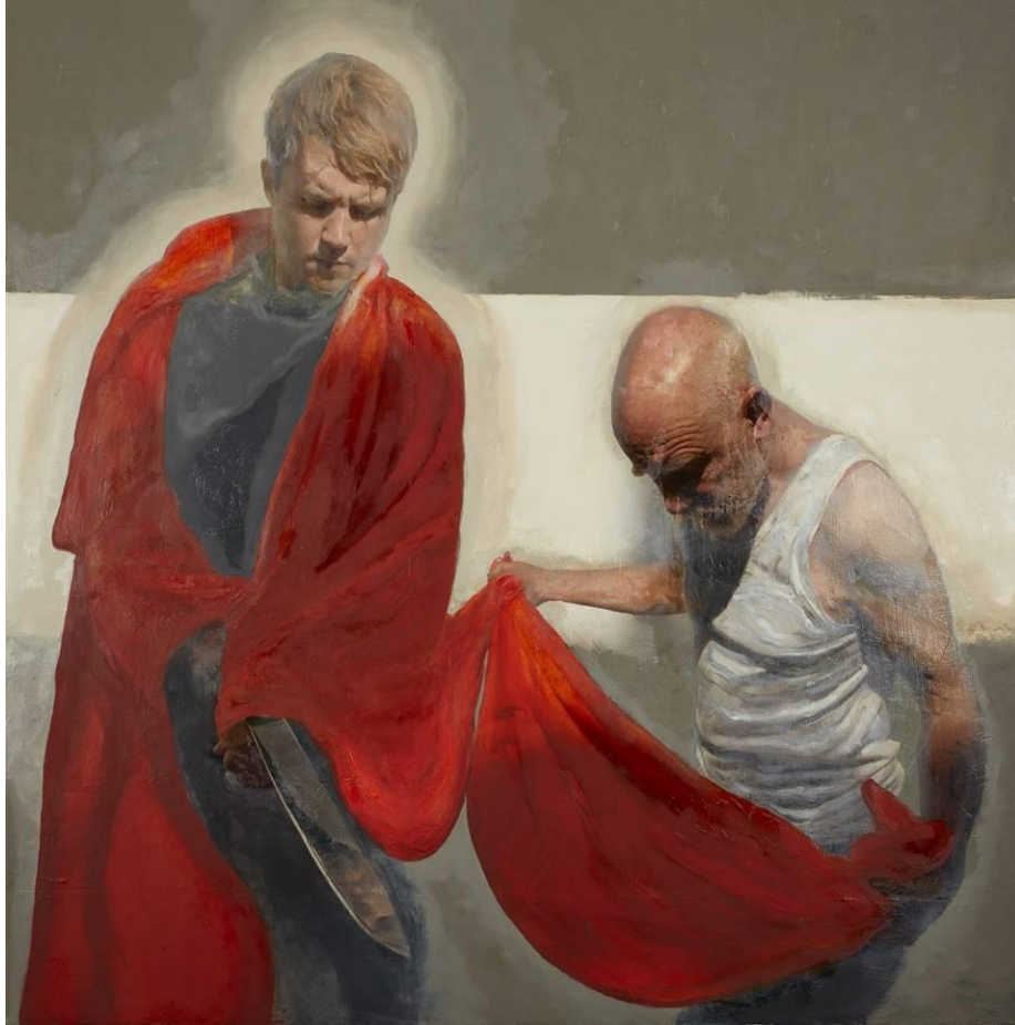
Hughie O'Donoghue's | St Martin Divides His Cloak

Maar het loopt anders. Zijn onbeholpen daad maakt iets los bij de mensen. Zo kan het dus ook! Een oud visioen komt tot leven: zwaarden kunnen ploegscharen worden. Dat is geen idealistische droom maar te doen!